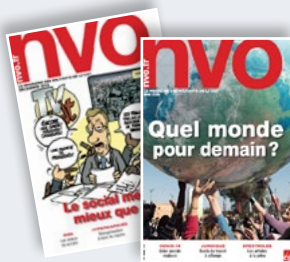
NVO, le magazine

Changez de regard sur l'actualité sociale et juridique